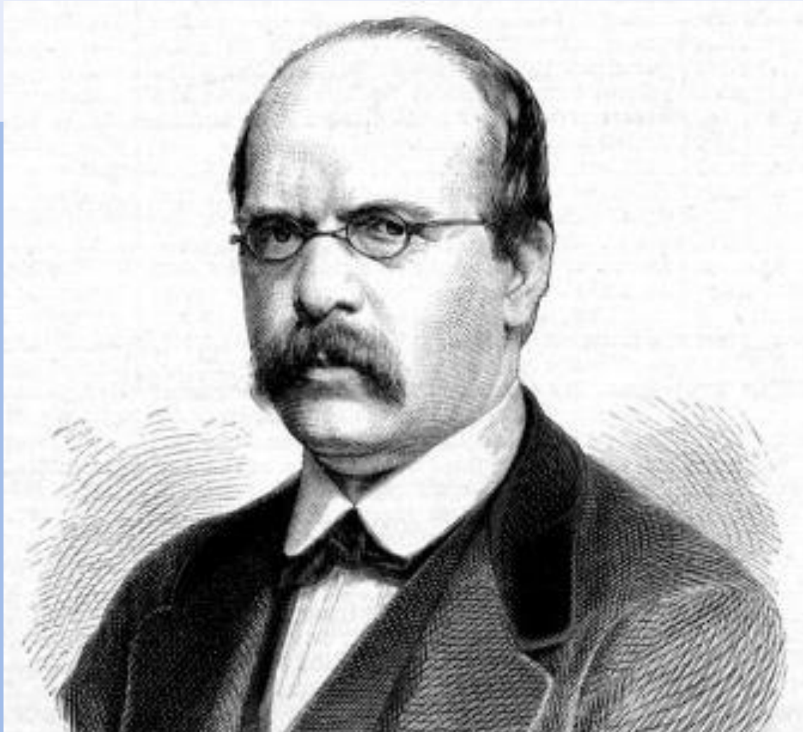
Johann Friedrich von Schulte